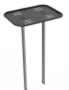
Etagère caméra fournie